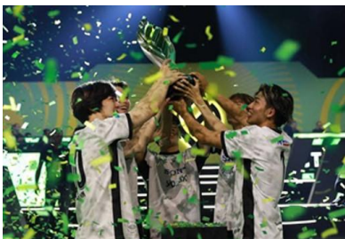
プロeスポーツチーム「REJECT」

【Yogibo パートナーシップ : https://yogibo.inc/csv/ 】