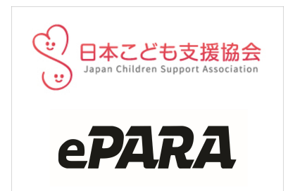
TANZAQ で広告出稿している 社会団体(一部)