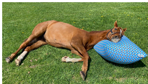
引退馬の余生を支える活動 Yogiboヴェルサイユリゾートファーム