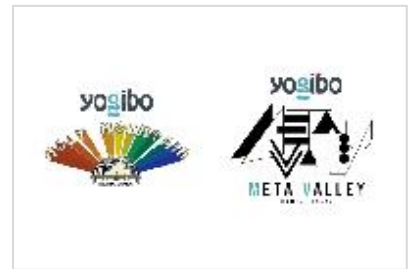
ライプハウスのネーミングライツ取得