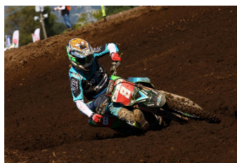
全日本モトクロス参戦チーム 「マウンテンライダーズ」 メインスポンサー