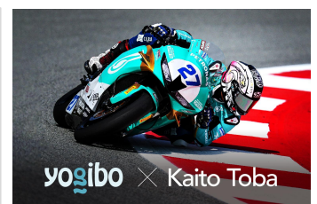
世界選手権MotoGP参戦 オートバイレーサー 鳥羽海渡選手スポンサー契約