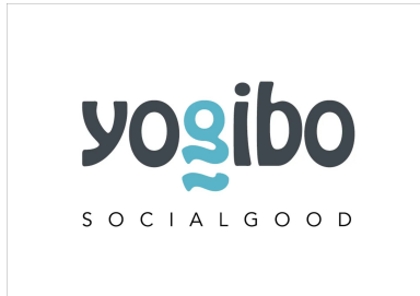
商品売上の5%を社会課題の解決に 「Yogibo Social Goodクーポン」

【Yogibo Social Good「TANZAQ(タンザク)」: https://tanzaq.jp 】