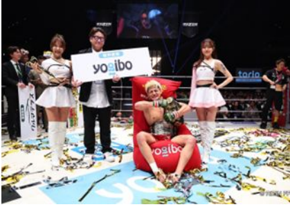
超RIZINを含む、RIZINナンバーシリーズ 2024 年間冠スポンサー