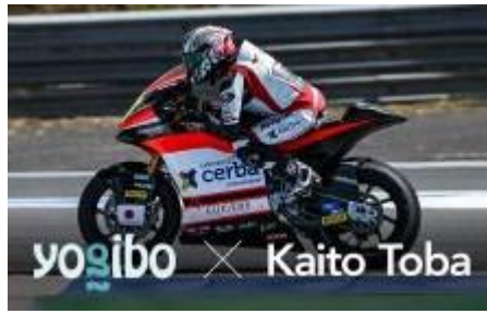
世界選手権 MotoGP参戦 オートバイレーサー 鳥羽海渡選手 スポンサー契約