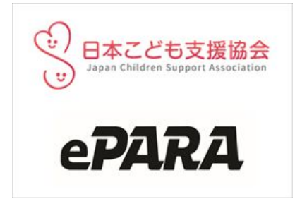
TANZAQ で広告出稿している社会団体（一部）