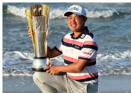
プロゴルファー金谷拓実選手 所属契約