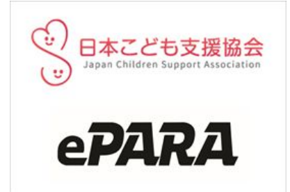
TANZAQ で広告出稿している社会団体（一部）