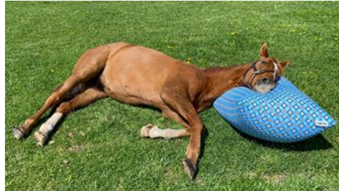
引退馬の余生を支援する活動 Yogiboヴェルサイユリゾートファーム