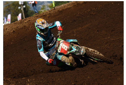
全日本モトクロス参戦チーム 「マウンテンライダーズ」メインスポンサー