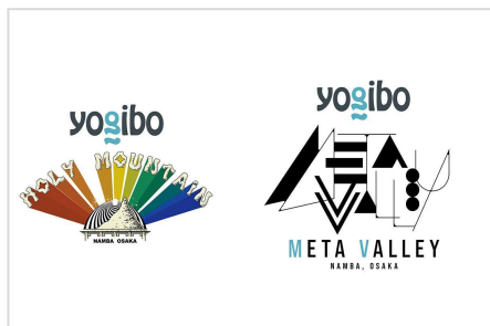
ライブハウスのネーミングライツ取得