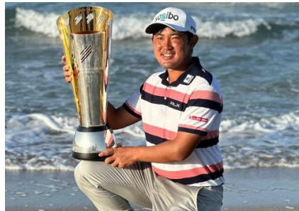
プロゴルファー金谷拓実選手 所属契約