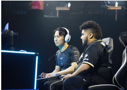
プロeスポーツチーム 「REJECT」

【Yogibo パートナーシップ： https://yogibo.inc/csv/ 】