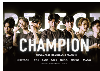
プロeスポーツチーム「REJECT」