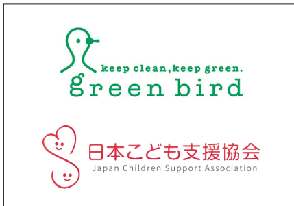
持続的な社会課題解決を目指す広告「TANZAQ」