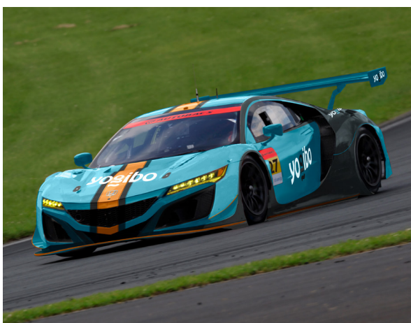
※この写真はイメージです。