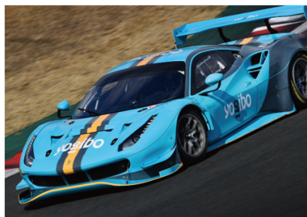
Yogibo Racing 2022 参戦車両 (Ferrari 488 GT3 EVO)

Yogibo パートナーシップ： https://yogibo.inc/csv/