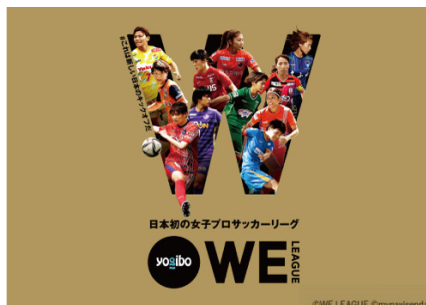
日本初の女性プロサッカーリーグ「WEリーグ」