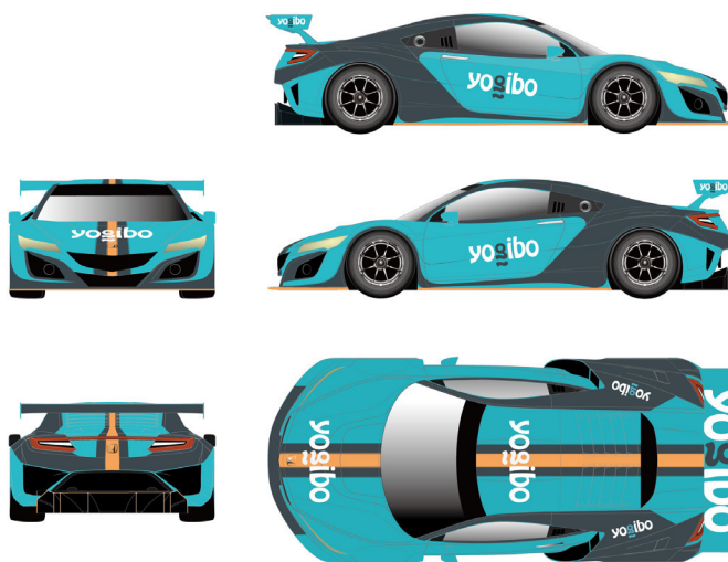
2023 Yogibo NSX GT3 Coloring Image