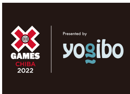
日本初開催のアクションスポーツ大会「X Games」