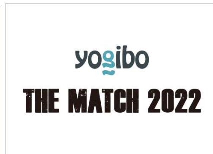
格闘技イベント「THE MATCH 2022」