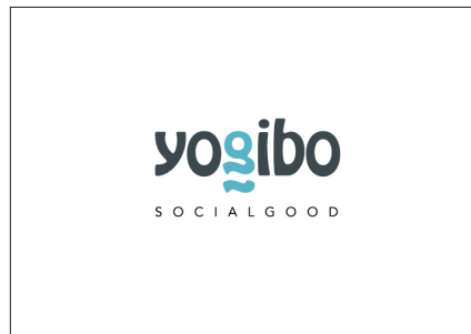
TANZAQ で広告出稿している社会団体（一部）