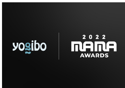
世界最大級のK-POP授賞式「2022 MAMA AWARDS」